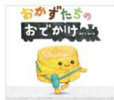
『おかずたちのおでかけ』(ひかりのくに)